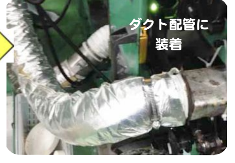
ダクト配管に装着