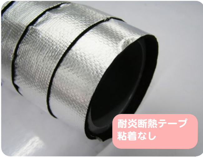
耐炎断熱テープ 粘着なし