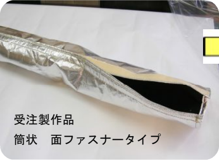
受注製作品 筒状 面ファスナータイプ

■耐炎フェルト： 特殊アクリル繊維を焼成し、炭化して製造した耐炎繊維です。高熱や、火炎に優れた防護性能を発揮し、熱や火炎を遮蔽し、防災、安全用品や断熱資材分野に適した素材です。