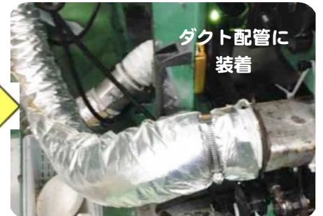
ダクト配管に 装着