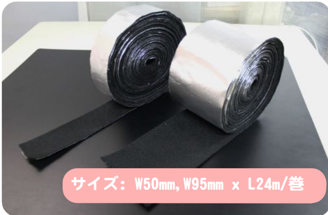
サイズ：W50mm, W95mm x L24m/巻

※ご注意：素材の能力を超えた環境、条件下で使用すると、蓄熱により温度が上昇して、発火する場合があります。素材は有機物なので「燃えないもの」ではありません。