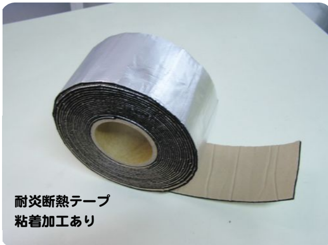
耐炎断熱テープ 粘着加工あり

※ご注意: 素材の能力を超えた環境、条件下で使用すると、蓄熱により温度が上昇して、発火する場合があります。素材は有機物なので「燃えないもの」ではありません。