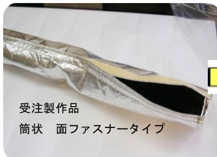
受注製作品 筒状 面ファスナータイプ

特殊アクリル繊維を焼成し、炭化して製造した耐炎繊維です。高熱や、火炎に優れた防護性能を発揮し、熱や火炎を遮蔽し、防災、安全用品や断熱資材分野に適した素材です。