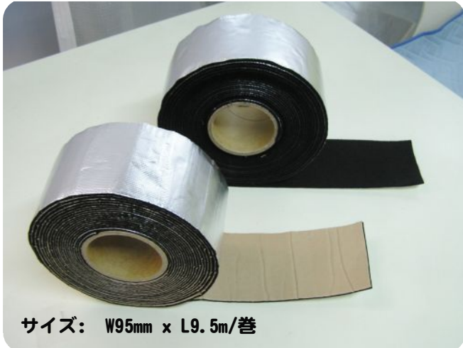
サイズ: W95mm x L9.5m/巻