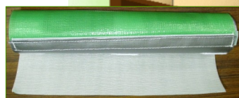
材料構成（イメージ図）