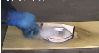
リチウムイオンバッテリー実験