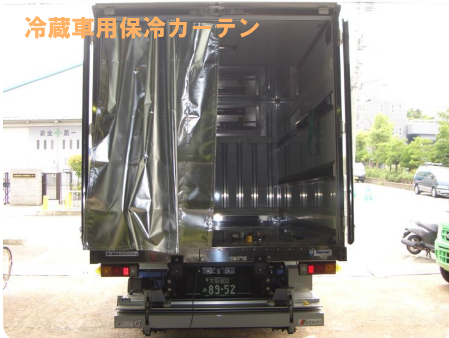
冷蔵車用保冷カーテン