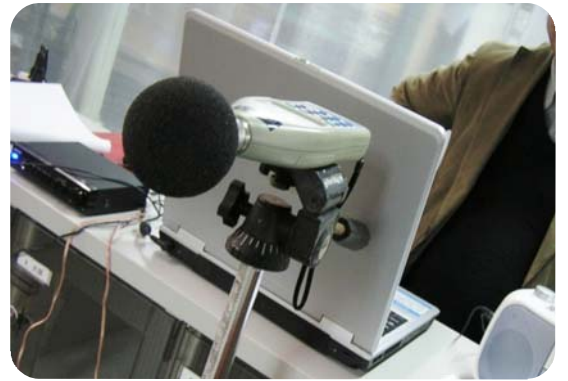
防音ハーフクリア (半透明防音シート 厚み1mm)

※ 厚み 1mm 重量 1192g/m 2 W1880mm x L28M/巻 ※防炎認定品