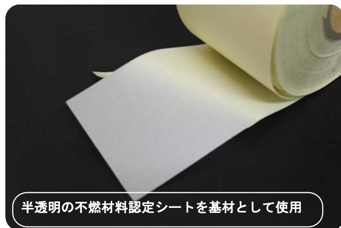
半透明の不燃材料認定シートを基材として使用