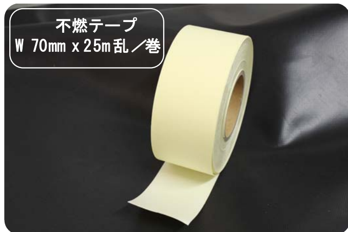
不燃テープ W 70mm x L 25m 乱巻