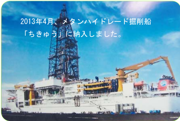
2013年4月、メタンハイドレード掘削船 「ちきゅう」に納入しました。

建材、設備、鉄道車両、自動車、産業機器、弱電分野などの断熱材、防火材、吸音材、シール材など。 各種の耐炎、難燃規格に対応する、高性能な機能材料の基材、表面材として最適です。