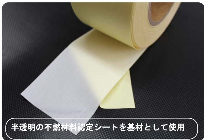
半透明の不燃材料認定シートを基材として使用