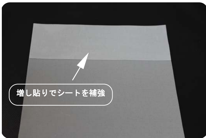
増し貼りでシートを補強